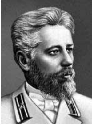
Гарин-Михайловский Николай Георгиевич

(1852, Петербург, - 1906) - русский писатель, видный инженер-путеец.