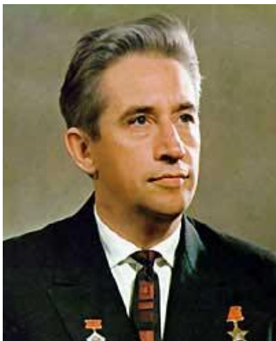
Феоктистов Константин Петрович