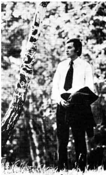
Карпов Анатолий Евгеньевич