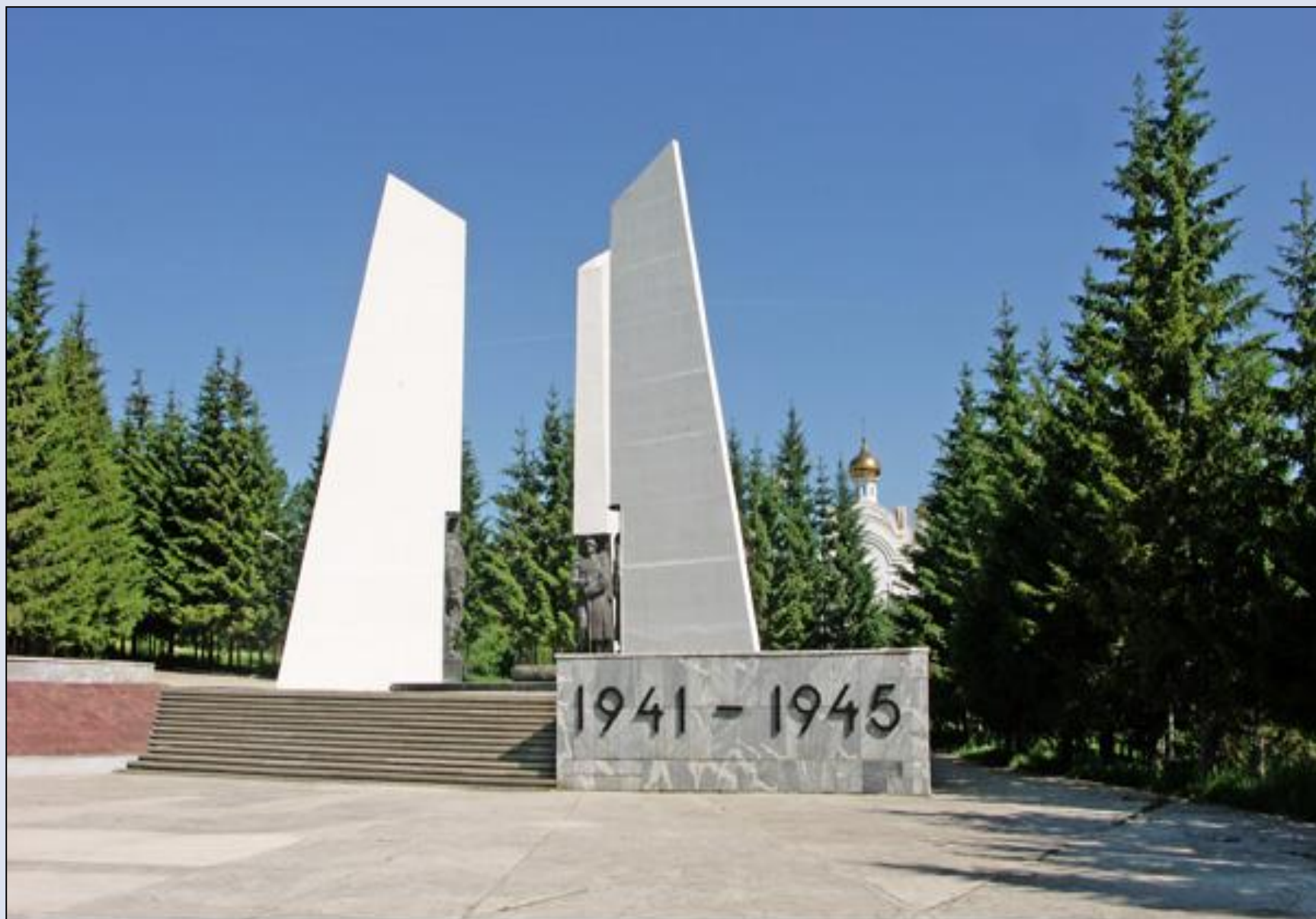
Мемориал, посвящённый златоустовцам, погибшим в Великой Отечественной войне 1941-1945 гг. 2008 г.